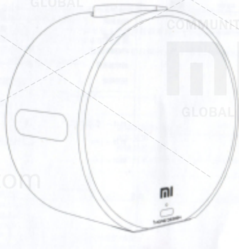
Тыльная сторона Mi Music Alarm Clock

В любом режиме дважды нажмите на кнопку питания, чтобы открыть настройки будильника. Прокрутите кнопку по часовой стрелке, чтобы установить минуты; против часовой стрелки, чтобы установить часы. После однократного нажатия на кнопку все настройки сохраняются, при двойном нажатии на кнопку настройки не сохраняются. LED цифровой дисплей указывает на часы, круглая маленькая точка указывает на минуты. После 12 часов на будильнике появляется значок «полумесяц», указывающий на послеобеденное время PM (12:00 – 24:00).