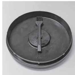
Щетка для чистки