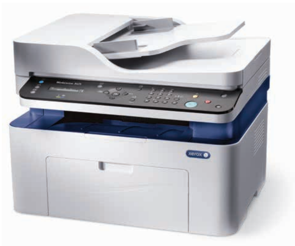
WorkCentre 3025. Копирование. Печать. Сканирование. Факс.*

* Факс и автоподатчик ADF предусмотрены только для модели WorkCentre 3025NI.